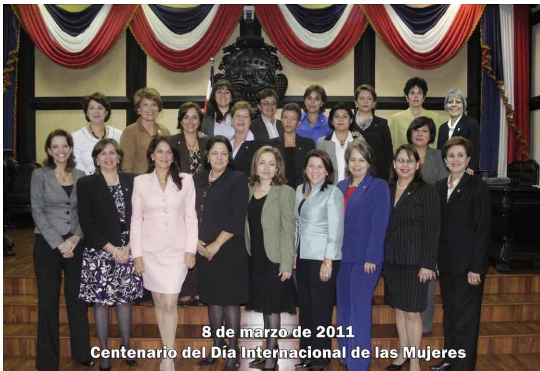
Diputadas de la Asamblea Legislativa

Es por ello que, mis proyectos, mis discursos, mis intervenciones y todas las armas que el Reglamento Legislativo pone a mi alcance, han sido para aportar un granito de arena a Costa Rica; las he utilizado al máximo, siempre tratando de alcanzar consensos de modo que las propuestas avancen sin demora.