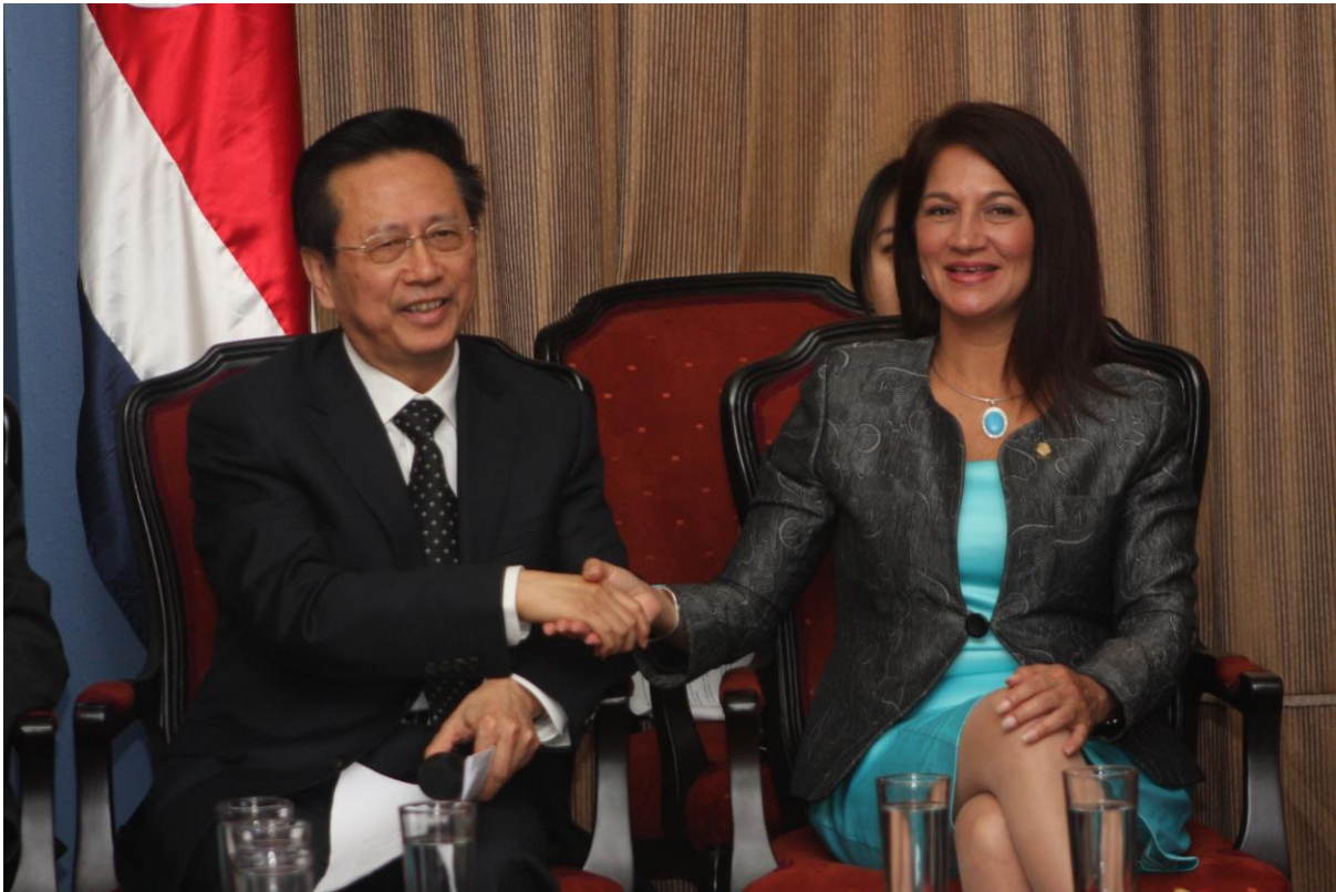
La Presidenta a.i. de la Asamblea Legislativa de Costa Rica, Mireya Zamora Alvarado, recibió el viernes 25 de marzo de 2011 la visita del Vicepresidente del Comité Permanente de la Asamblea Popular Nacional de China, Chen Changzhi.

El principal ejemplo de esta labor fue la presentación de la Moción de Voto de Censura ante el Plenario Legislativo contra el Ministro de Obras Públicas y Transportes, Francisco José Jiménez Reyes, el 26 de agosto de 2010, motivada por la deficiente gestión que ha ejercido el jerarca desde que asumió esta importante cartera.