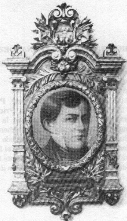
Juan Mora Fernández